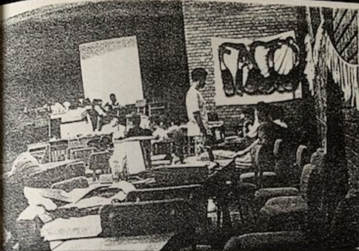
Pohled na halu, kde se party konala. Uprostřed se Crow baví s maníky z Triumviratu.

Crowa se tam mezitím pokoušela sbalit jedna místní neuvěřitelně ošklivá holka (zřejmě členka HEADWAY). Pokaždé když šel okolo dveří, kde dotyčná vybírala vstupné, tak ho chytla, dala mu nové razítko na ruku a různě ho hladila apod. (Ed. Crow sice petting rád, ale vzhled dotyčné dívky (???) v něm vyvolal absolutně opačné reakce než vzrušení). Holka se neujala.