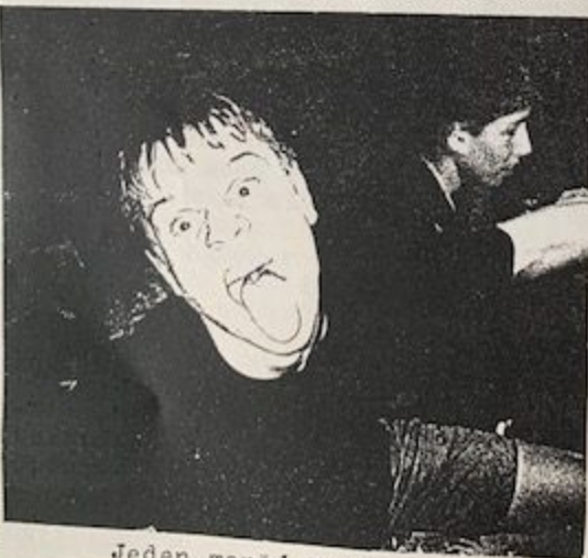
Jeden menší Necromantic

trio Galland, Junkyard a Reign na film The Cure in Orange, který se promítal ve zdejším letním kině. Vstupné bylo nelidské (50,—) a tak jsme hledali cesty, jak film shlédnout a finančně se přitom nezruinovat. Galland spolu s jedním lokálním anarchistou vylezl na strom za hledištěm a díval se odtud.