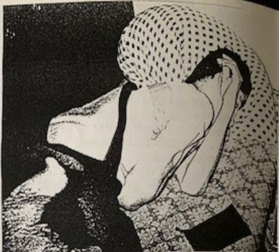
Reign ráno po akci

nevěděli, že je to 5 km daleko a že se půjde pěšky. Když jsme po hodinové túře dorazili konečně před disko, chlapci z Trash nám už otevřeně nadávali, protože byli na pokraji fyzických sil. Navíc nás momentálně nechtěli pustit dovnitř, tak se 2H, Sid a Riff sebrali, chytili taxíka a jeli zpět. Galland, já, Pina, Mateus a Moron jsme šli zpátky pěšky a po cestě drbali scénu a podobně