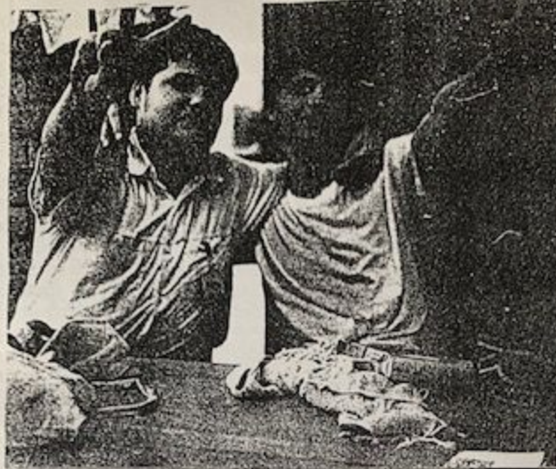
Dylance/Headway a Reign/ex-Rush

se táhl postupně za ním jako krysy za krysařem. Bylo to fatální. Pak jsme si sedli do nějaké pizzerie a začali popíjet. Velký úspěch sklídila naše starorežná, kterou jsme přivezli s sebou. Když jsme se kymáceli zpět, vyběhl na nás z nějaké zahrady vlčák a začal zuřivě štěkat. To se nelíbilo maníkům z Graffity, tak začali štěkat taky a posléze na neobehého psa uspořádali štvaniční.