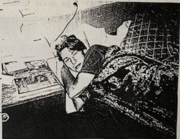
Galland ráno po akci

nevydržel a zašel si koupit lahev červeného vína Admirál, které za krátko sám vypil. Při konzumaci nahodil odborný výraz a každou sklenku náležitě degustoval. Když jsme ho upozorňovali, že by to neměl přehánět, říkal: "Já to vydržím, to nic není, jsem OK!"